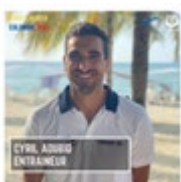
Entraîneur en chef