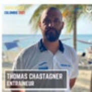
Entraîneur en second