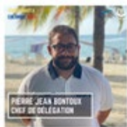
Chef de délégation