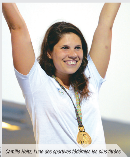
Camille Heitz, l'une des sportives fédérales les plus titrées.