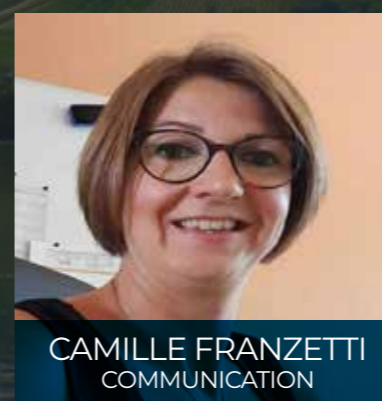
CAMILLE FRANZETTI COMMUNICATION